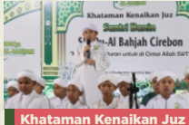
Khataman Kenaikan Juz