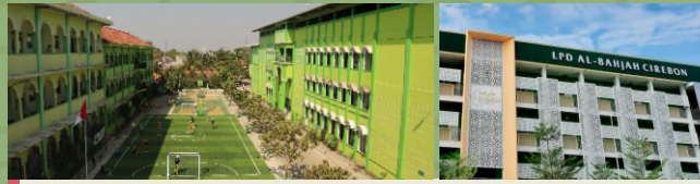
Gedung Sekolah, Gedung Asrama, dan Lapangan Olahraga